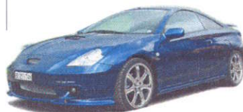
Sport-Garage Widmer am ATVSL-Testtag: Bahn frei für den Toyota Celica 1.8 VUT-i Kompressor

Die Anmeldefrist für Aussteller am ATVSL-Testtag läuft noch. Nutzt die Gelegenheit und überzeugt die Presse von gutem Tuning. Kommt mit den besten Autos und Argumenten nach Interlaken!