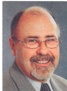
Das Wort des ATVSL-Präsidenten

Um der Schweizer Presse das Thema Auto-Tuning real vorzuführen, fordert der ATVSL-Vorstand alle Mitglieder auf, am 23.08.2002 mit ihren besten Tuning-Fahrzeugen auf den Flughafen Interlaken zu kommen, um den Presseleuten zu zeigen, was der aktuelle Stand der Technik ist. Ziel des Pressetages ist es, zu beweisen, dass Tuning viel mit Sicherheit zu tun hat. Bei den lokalen und nationalen Medien soll Tuning als berichtenswert eingestuft werden und die emotionale Hemmschwelle bei den Journalisten wollen wir mit einer Probefahrt senken. Zeigt, was modernes Tuning bedeutet und erklärt, warum gutes Tuning nichts mit Umweltverschmutzung zu tun hat.